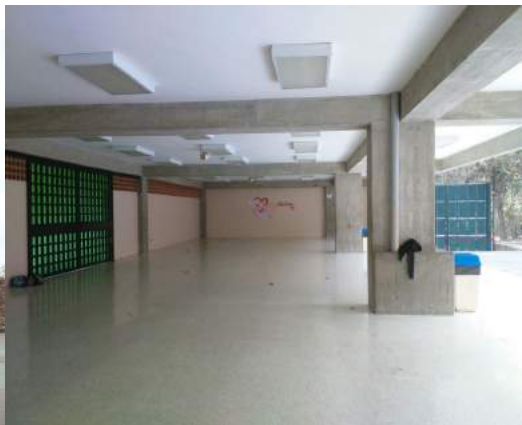
Foto 2: Instituto Andes, toque de egresadas, espacio en donde se encontraba la tarima, filmación a instrumento.