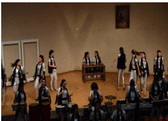
Foto 5: Auditorio Instituto Andes, presentación a directora (también se realizó aquí el toque a AVEPANE), filmación a baile.