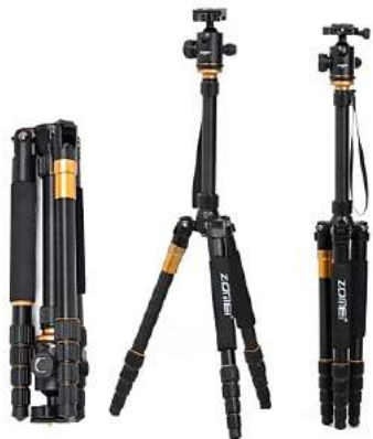
Tripode Zomei Z668C