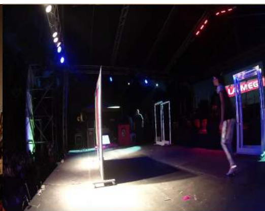
Foto 6: Tarima del Instituto Andes, filmación a baile, canto y backstaae.