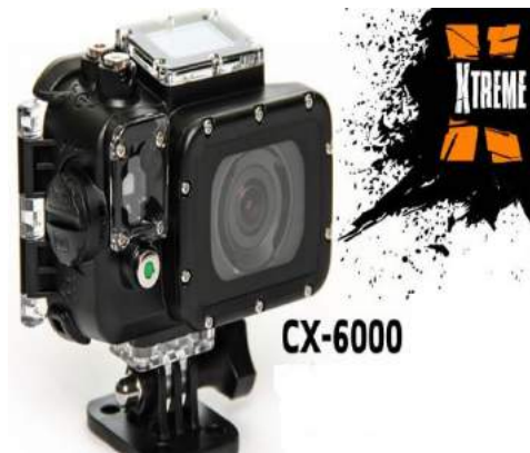
Siragon Xtreme 6000