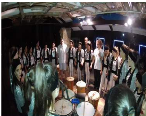
Foto 3: Casa Elisa Fernández, presentación a coordinadoras, filmación a instrumento.