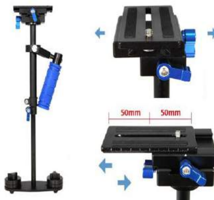
Estabilizado Studio FX