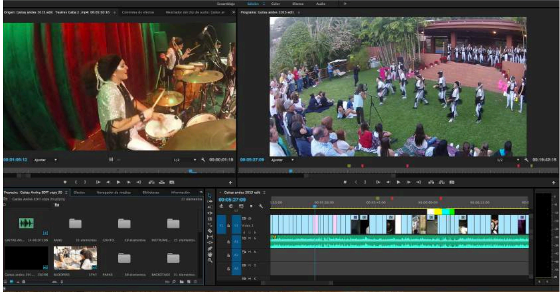
Programa de edición Adobe Premiere Pro CC 2015