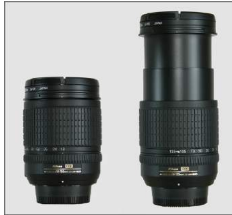
Lente Nikon 18-135mm