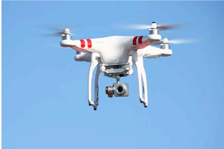
DJI Phantom 2