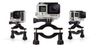
Montura de tubo para Siragon Xtreme 6000