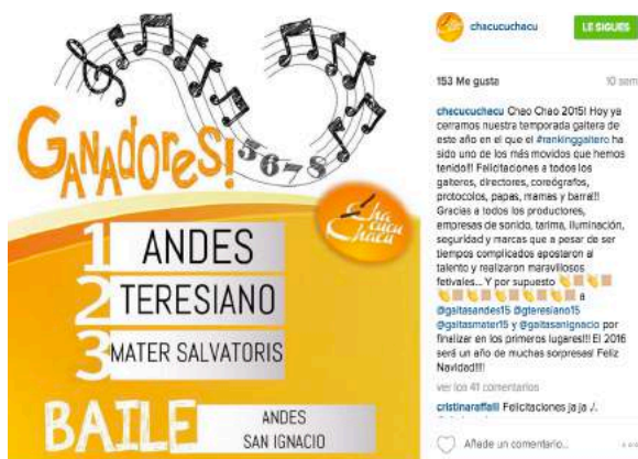
Anexo 2: Ganadores Rankin Gaitero 2015