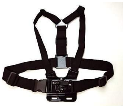
Arnés de cintura para Siragon Xtreme 6000