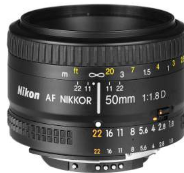
Lente Nikon 50mm fijo