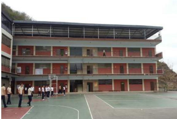
Foto 1: Colegio Yale, espacio en donde se encontraba la tarima, filmación al baile.