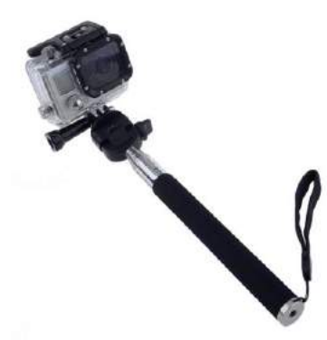
Selfie Stick para Siragon Xtreme 6000