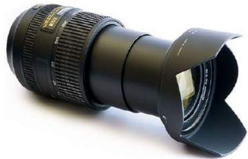
Lente Nikon 55-300mm