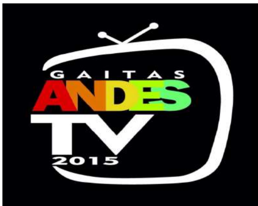
Anexo 1: Logo Gaitas Andes 2015