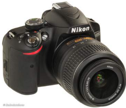
Cámara Nikon D3200 con su lente 18-55mm