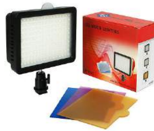
Luz Led LE160C