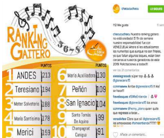
Anexo 3: Puntuación Rankin Gaitero 2015