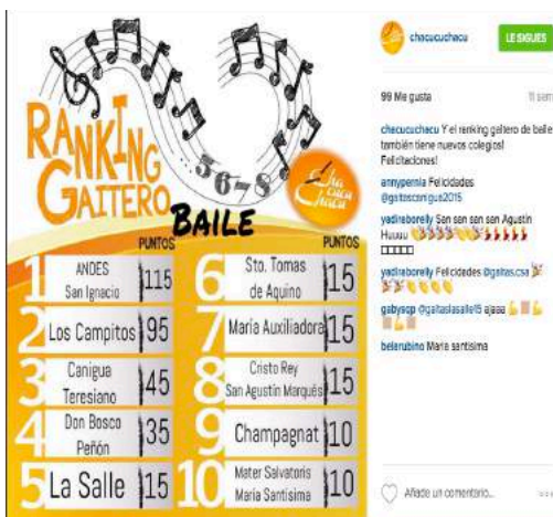
Anexo 4: Puntuación Rankin Gaitero en baile