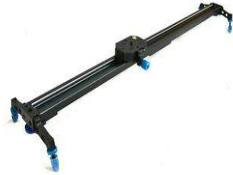
Slider 40 Studio FX