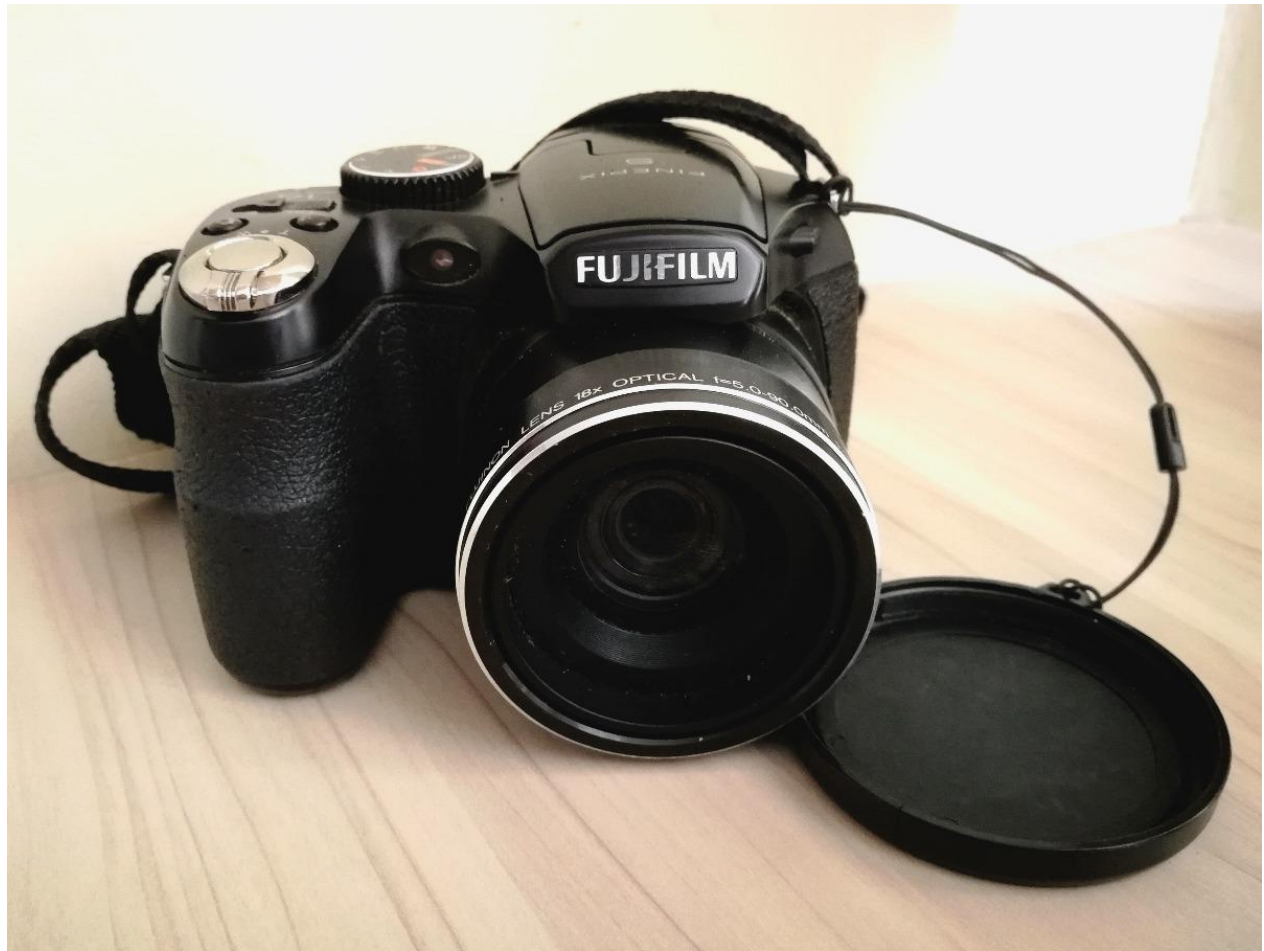
- Modelo de cámara FujiFilm usada para la realización del documental.