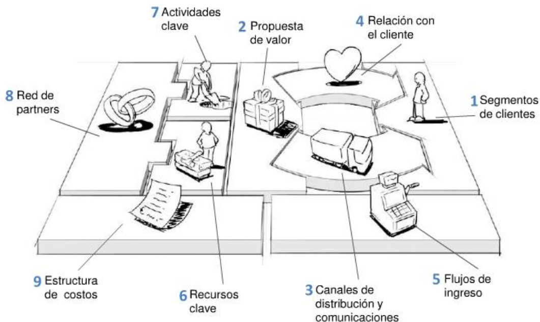
Ilustración II.1. Lienzo de modelo de negocios Canvas (BUSINESS MODEL CANVAS) por sus siglas en Inglés