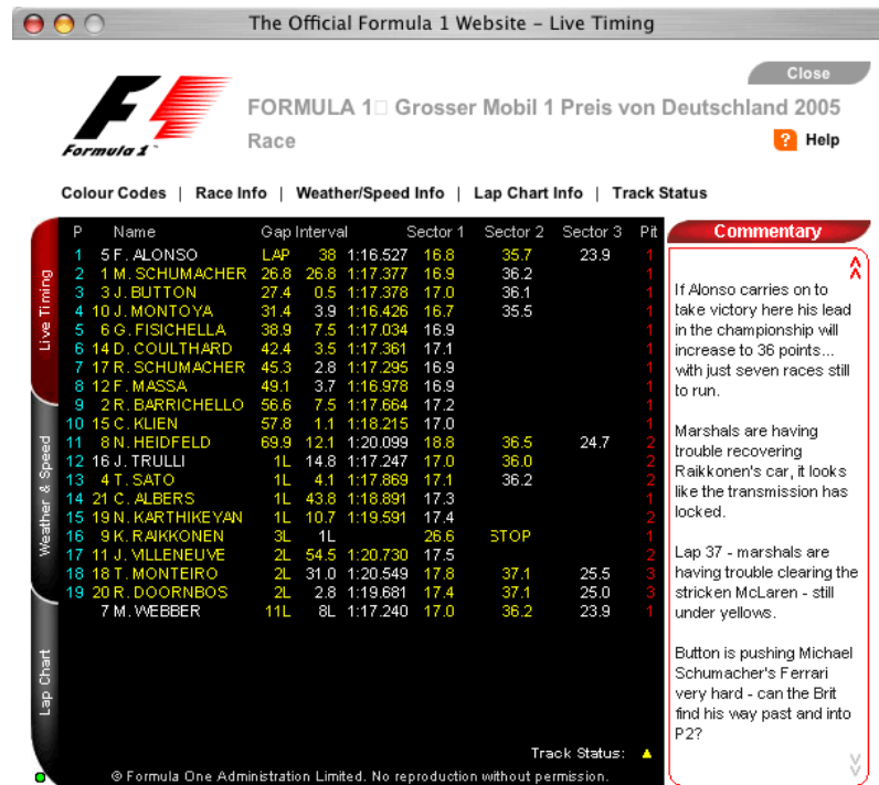
Gráfico 3. F1 Live Timing