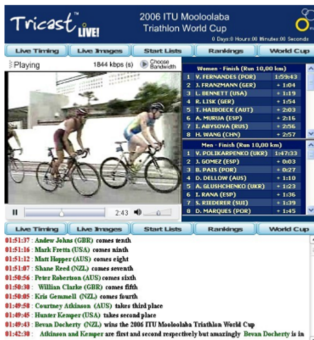
Gráfico 4. Sistema Tricast

La estructura en pantalla de la alternativa “Tricast Live” posibilita ver diferentes contenidos en vivo de la competición.