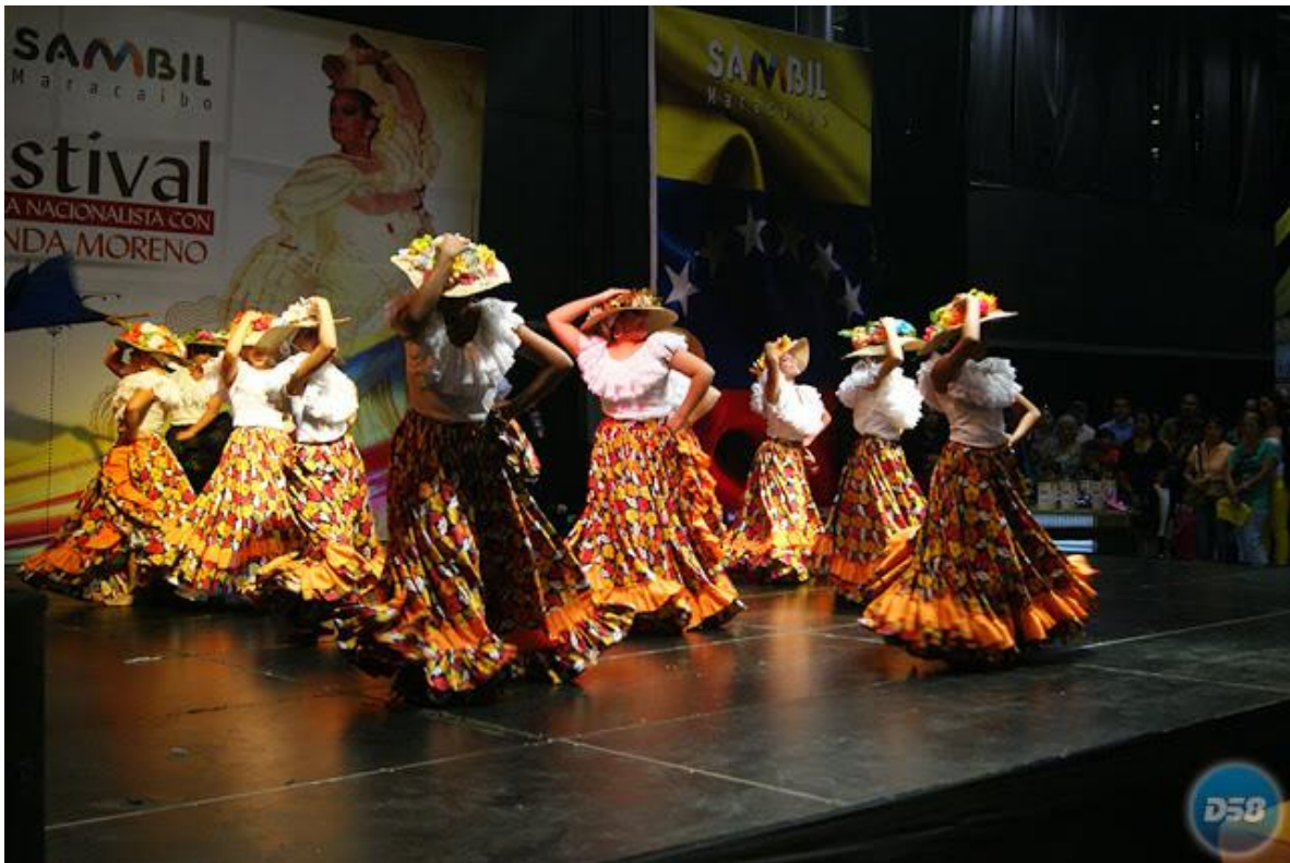
Vestuarios del Joropo de Oriente.