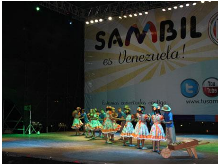
Festival del Grupo Sambil, Danzas.