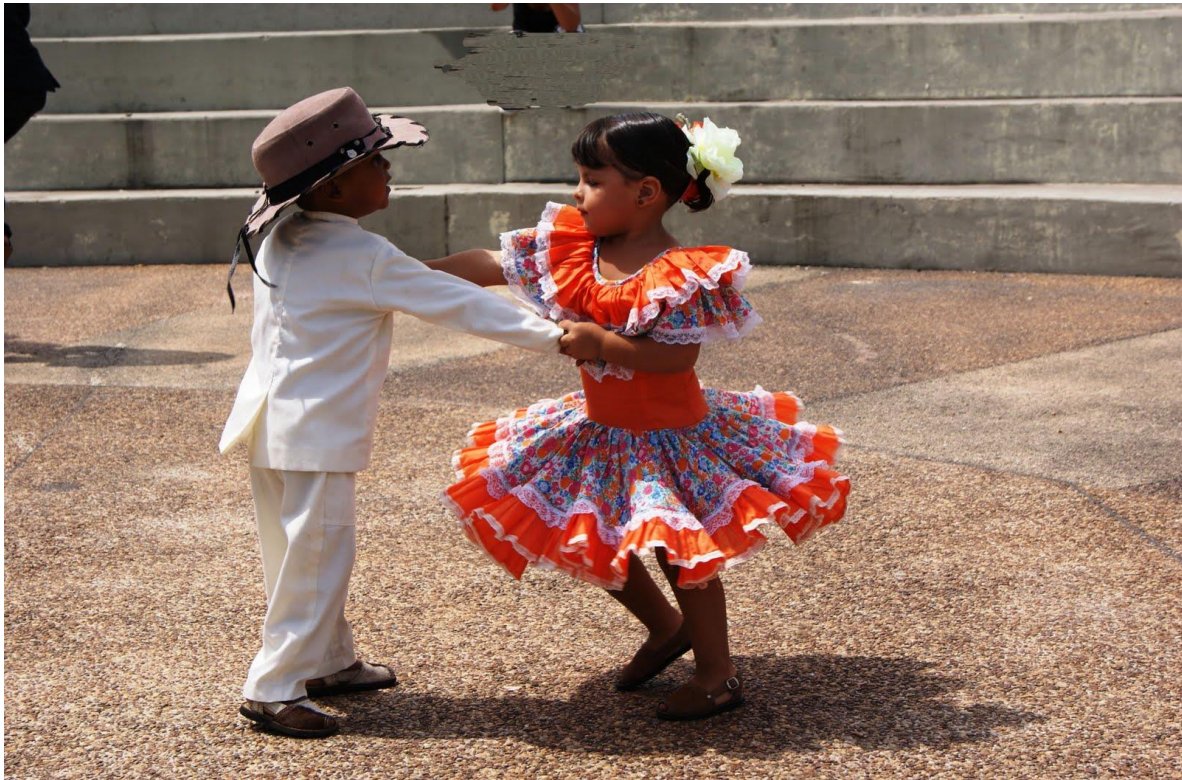
Joropo de Oriente