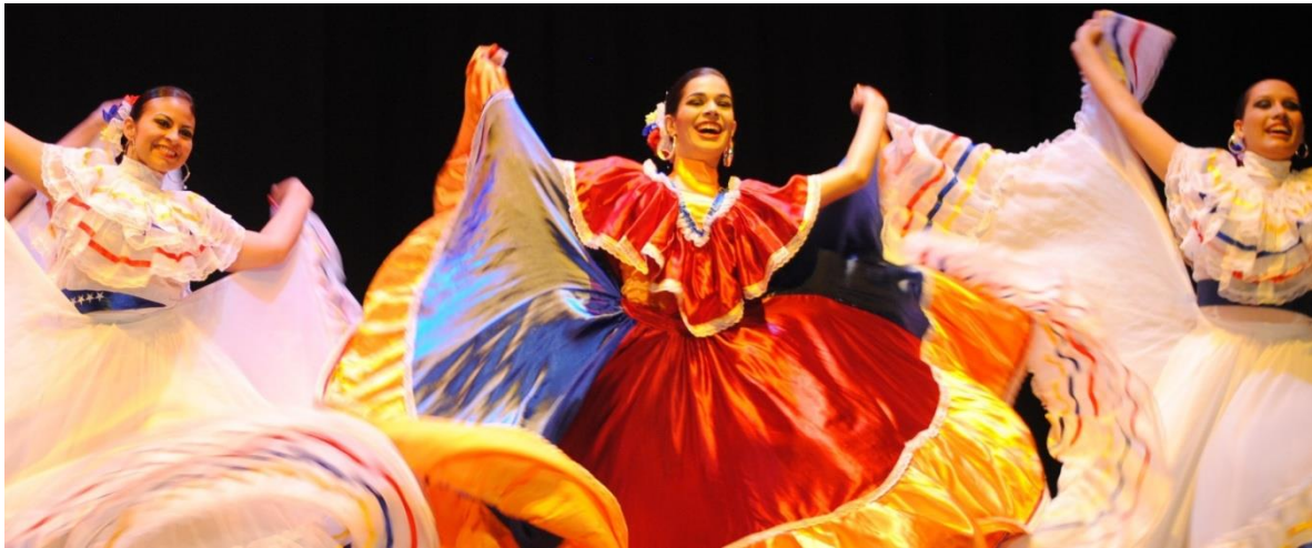
La sencillez de los trajes con colores vivos.