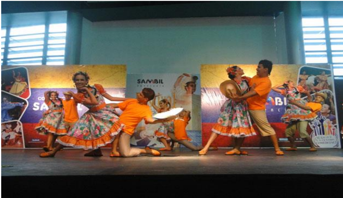
El enriquecimiento de los trajes.