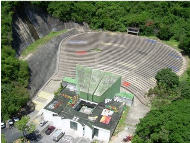
Vista desde arriba