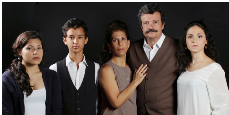
Elenco de la obra