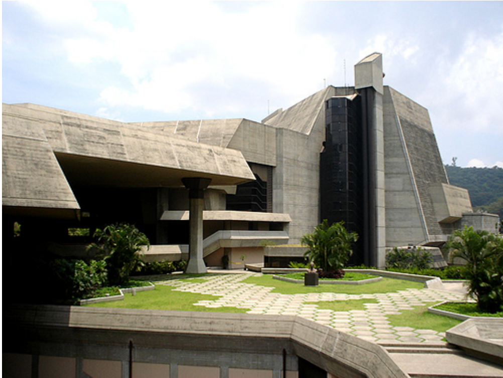
Teatro Teresa Carreño