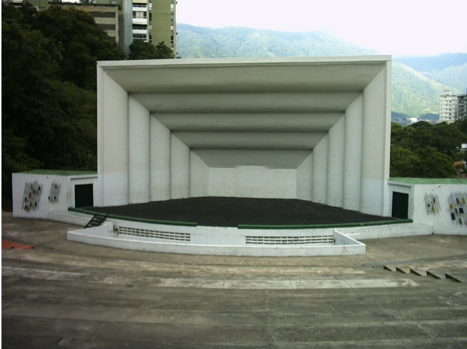
Concha Acústica de Bello Monte