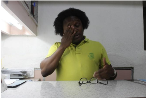
Entrevista a Chusmita (Camerino Teatro Teresa Carreño)