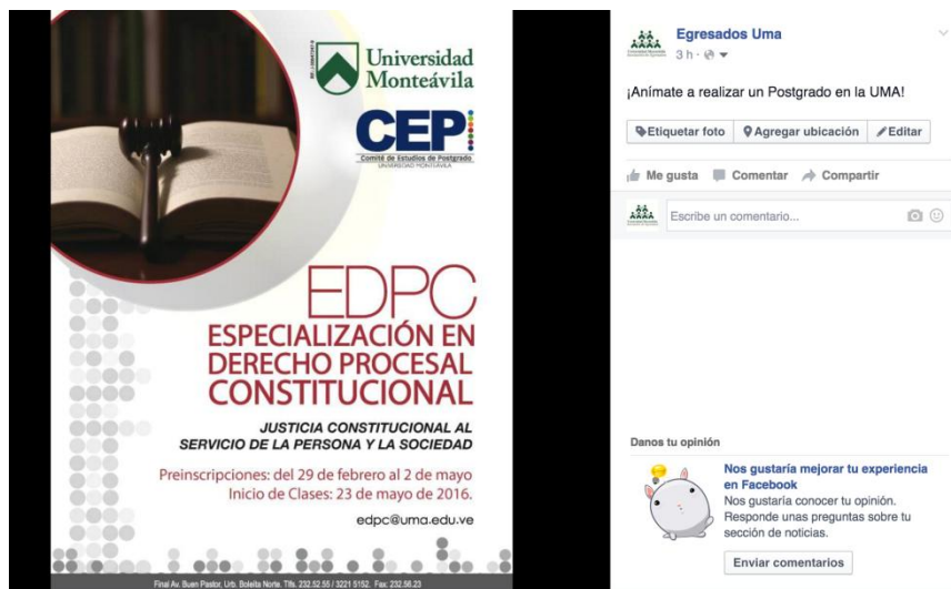
Figura 17: Captura de pantalla de la Página de Egresados UMA en Facebook