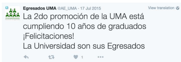
Figura 1: Captura de Pantalla último post @AE_UMA en Twitter