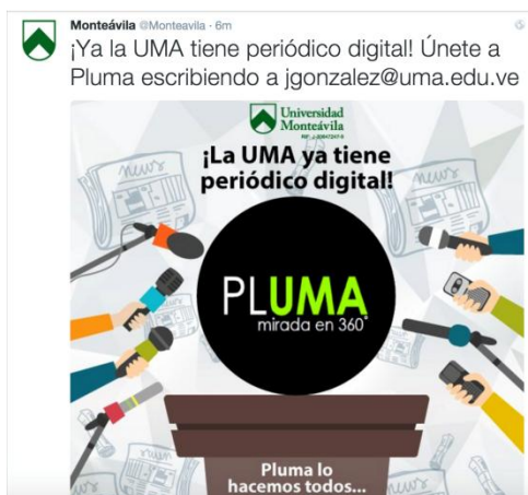
Figura 2: Captura de pantalla último post @Monteavila en Twitter