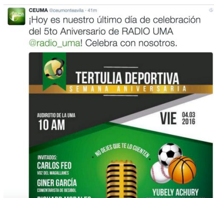
Figura 3: Captura de pantalla último post @ceumonteavila en Twitter