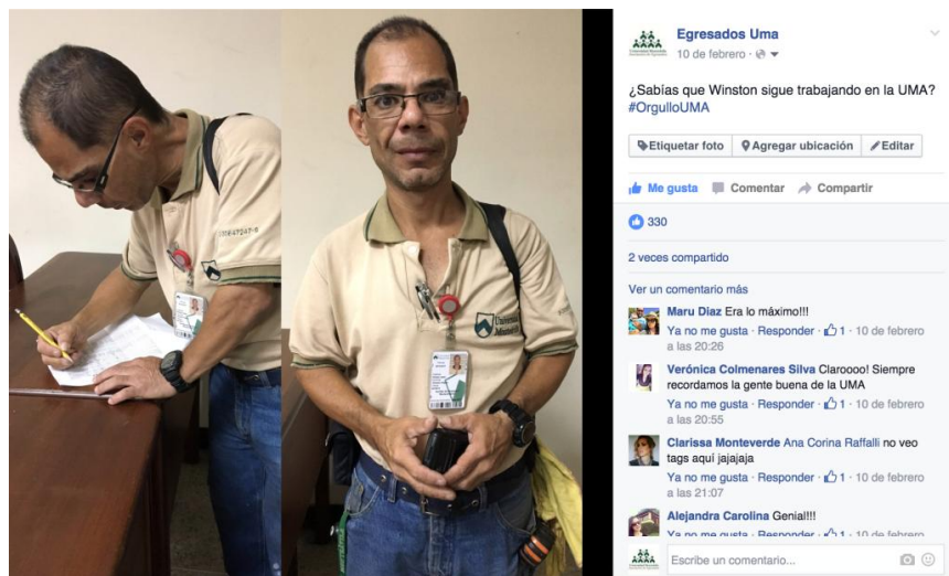
Figura 12: Captura de pantalla de la Página de Egresados UMA en Facebook