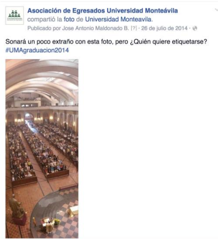
Figura 4: Captura de pantalla de la Página de Asociación de Egresados Universidad Monteávila en Facebook