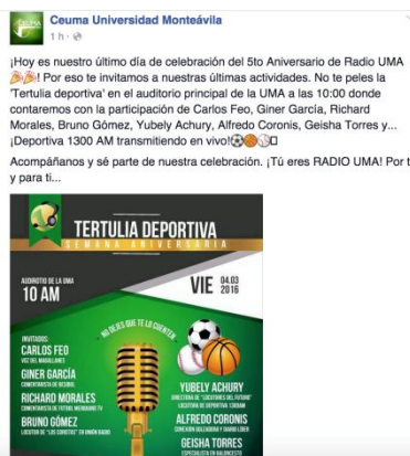
Figura 5: Captura de pantalla de la Página de Ceuma Universidad Monteávila en Facebook