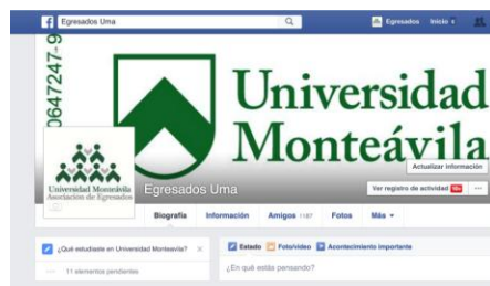
Figura 8 : Captura de pantalla de la Página de Egresados UMA en Facebook