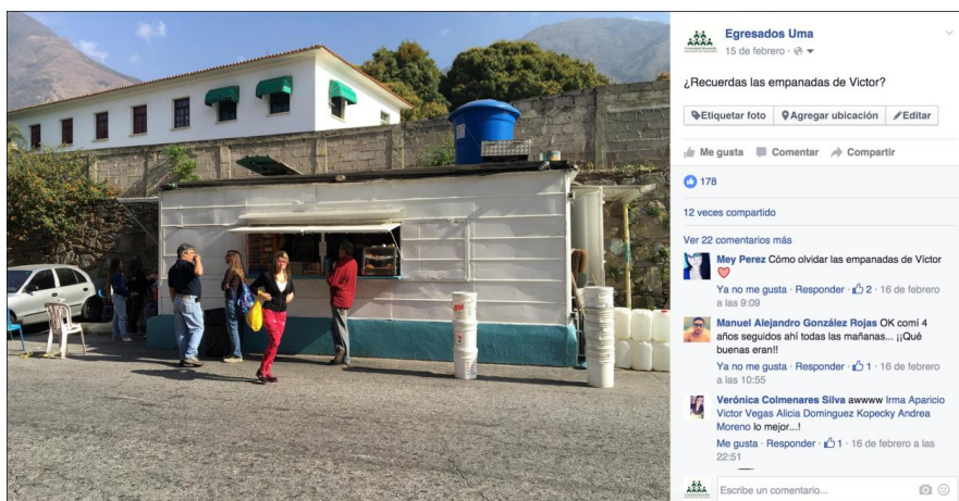
Figura 13: Captura de pantalla de la Página de Egresados UMA en Facebook