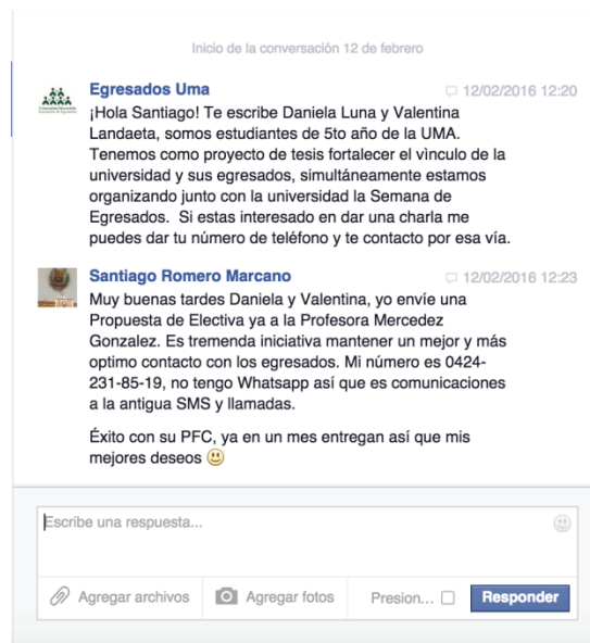
Figura 16: Captura de pantalla de la Página de Egresados UMA en Facebook