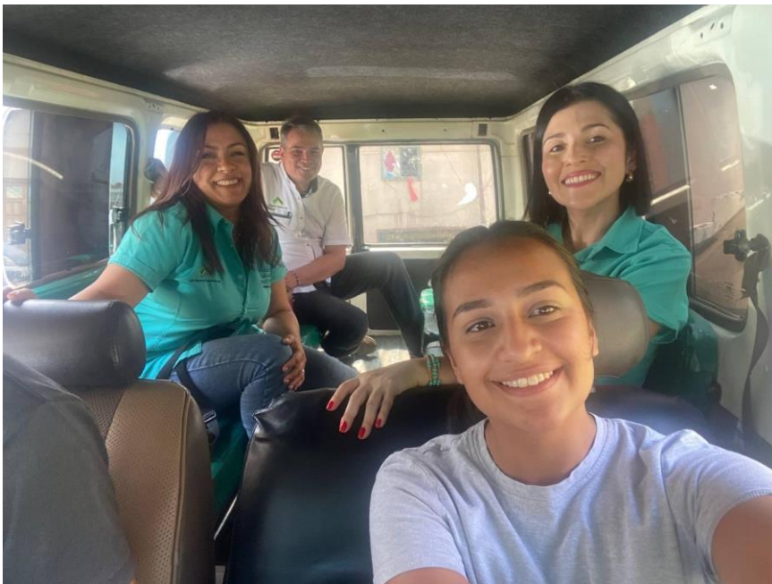
Caracas, sábado 1 de junio de 2024.