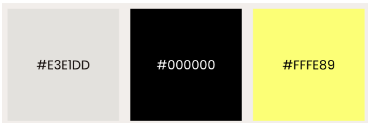
Figura 3: Paleta de colores del proyecto Talking w Carlux

Estos tres colores se eligieron debido a que el blanco y el gris son tonalidades que iban en consonancia con la identidad visual y diseño de la marca y que transmiten atemporalidad y exclusividad, además de sobresaltar con colores clásicos y vanguardistas que casi nunca son empleados para medios de comunicación directamente, sino para otro tipo de empresas y modalidades. Con el color amarillo lo que se buscaba era subrayar y llamar la atención en ciertas oportunidades, dando un toque de luz y alerta ante su uso.