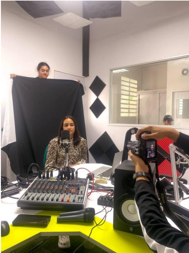
Caracas, viernes 17 de mayo de 2024.