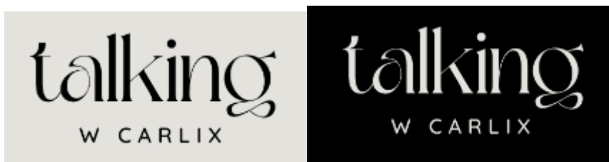
Figuras 1 y 2: Logo del proyecto Talking w Carlix

5.4.1 Logo: es atemporal, con letras clásicas y no usa ningún tipo de signo, únicamente el nombre completo del medio.