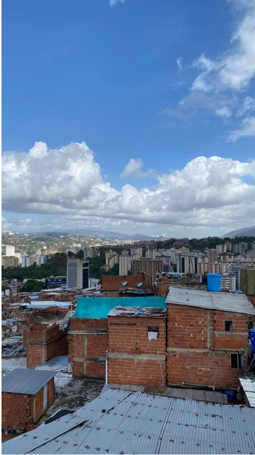
Caracas, sábado 1 de junio de 2024.